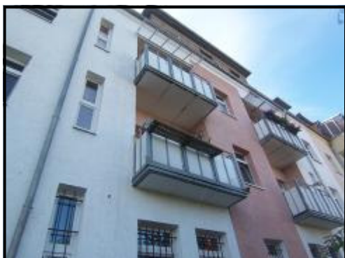
Fachada interior (Back facade)